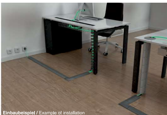
Einbaubeispiel / Example of installation

Exit Floor in anderen Längen und in den Abmessungen (35x10mm und 50x12mm) auf Anfrage lieferbar / Exit Floor in other lengths and measurements (35x10mm and 50x12mm) available upon request